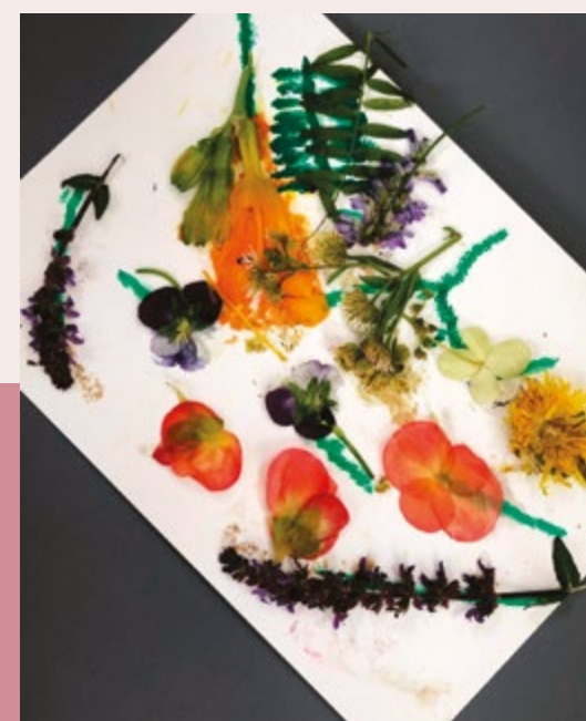
Aquarelle avec empreintes de fleurs